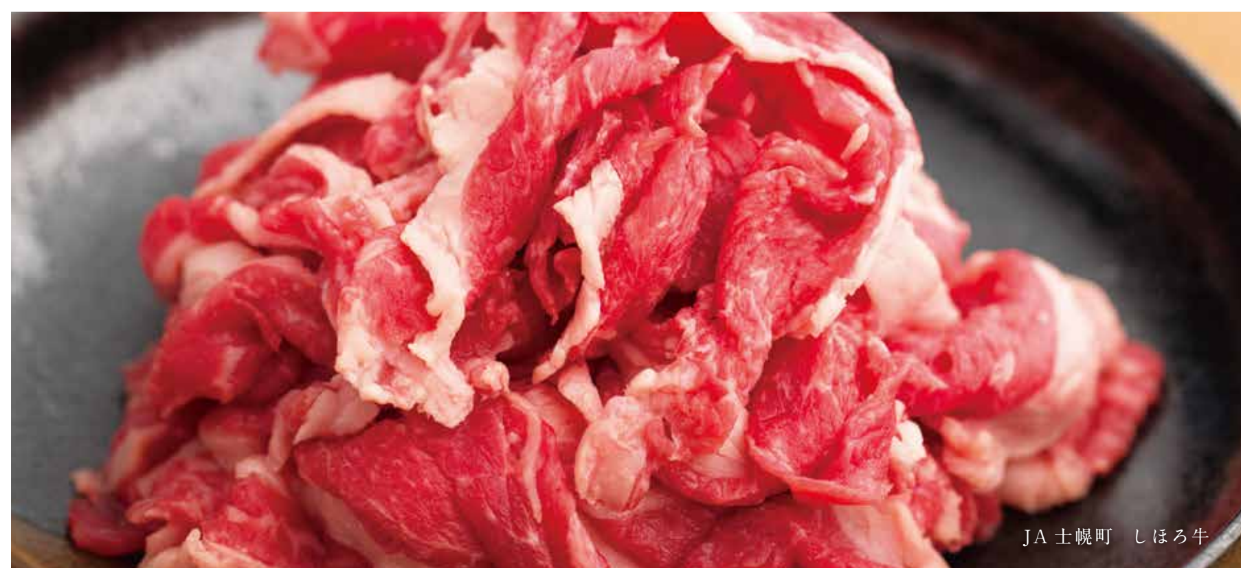
JA 土幌町 しほろ牛