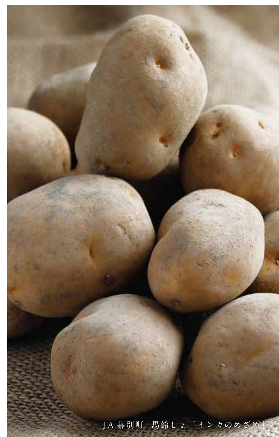
JA 幕別町 馬鈴しょ「インカのめざめ」