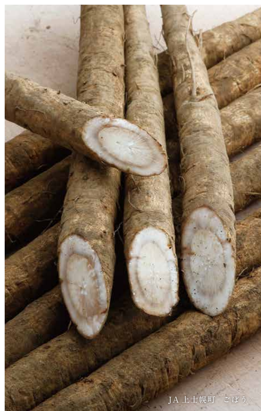
JA 土幌町 ごぼう